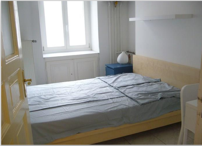
Petite pièce sur cour