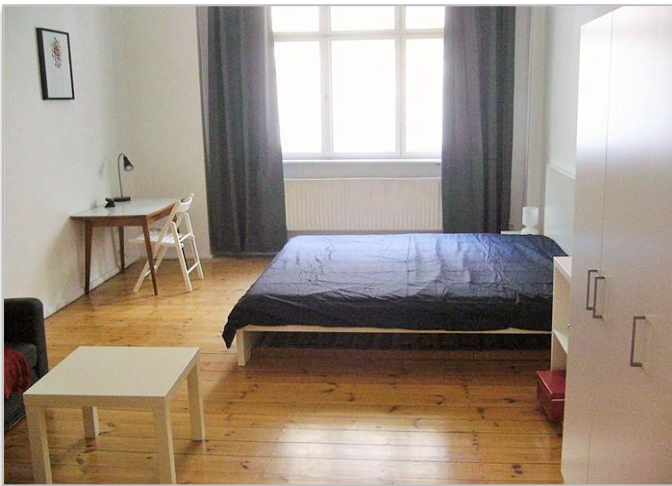
Grande chambre sur rue