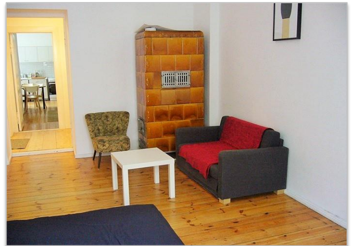
Grande chambre sur rue – vue vers le salon